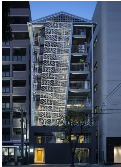
Common de -Hostel & Bar- 所在：福岡市博多区古門戸町 7-13 開業：2018年2月 客室数：39室