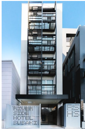
RIVERSIDE HOTEL SUSAKI 所在：福岡市博多区須崎町 8-10 開業：2019年1月 客室数：9室