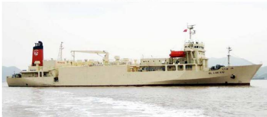
GL LAN XIU

船名 : GL LAN XIU (船籍 : パナマ) 船種 : 家畜運搬船 (2000頭積み) 総トン数 : 6296トン 竣工年 : 1995年 (大規模改造 : 2011年)